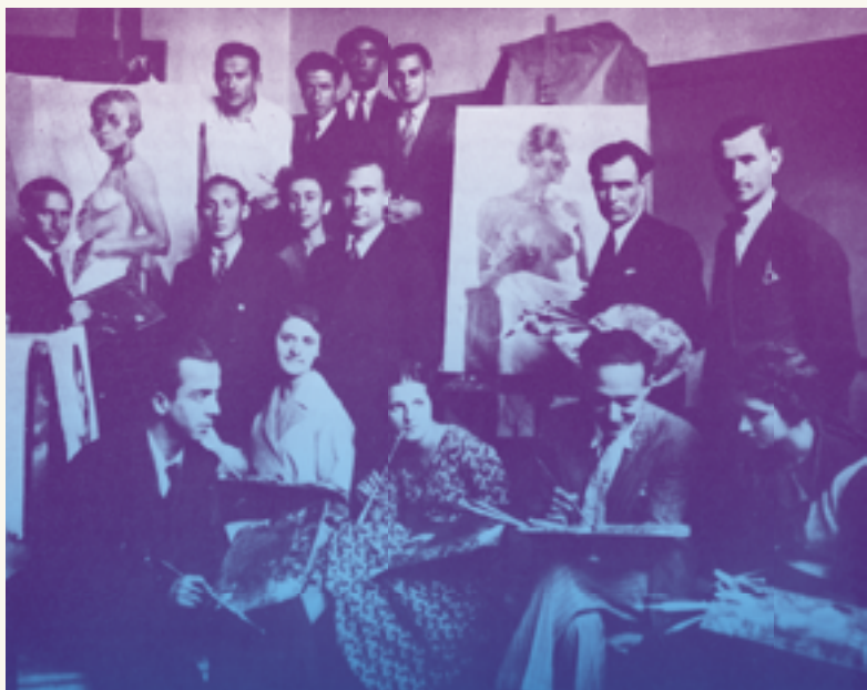
Ομάδα σπουδαστών της Σχολής

Τον Ιακωβίδη θα τον διαδεχθεί στη διεύθυνση της Σχολής ο Κωνσταντίνος Δημητριάδης, ο οποίος διορίζεται με ειδική νομοθετική πράξη. Με το Νόμο 4791 που δημοσιεύθηκε στις 3 Ιουλίου 1930 η Σχολή ανωτατοποιείται (εφόσον καθίσταται ισότιμη με το -ήδη αναγνωρισμένο ως ανώτατο- Εθνικό Μετσόβιο Πολυτεχνείο) αλλά και ανεξαρτητοποιείται. Η Ανωτάτη Σχολή Καλών Τεχνών, αρχικά καλλιτεχνικό τμήμα του Σχολείου των Τεχνών, κόβει τότε τον ομφάλιο λώρο που τη συνέδεε με το Πολυτεχνείο και εξελίσσεται πλέον ως ανεξάρτητο εκπαιδευτικό ίδρυμα με κύριο στόχο «την εν ταις εικαστικαίς τέχναις πρακτικήν και θεωρητικήν μόρφωσιν καλλιτεχνών». Ο συμβολισμός της αποκοπής υλοποιείται με την απόλειψη του τελευταίου ίχνους τούτης της παλαιάς συμβίωσης: το Σχολείο των Κυριακών καταργείται με τη συνταξιοδότηση και του τελευταίου διδάσκοντος.