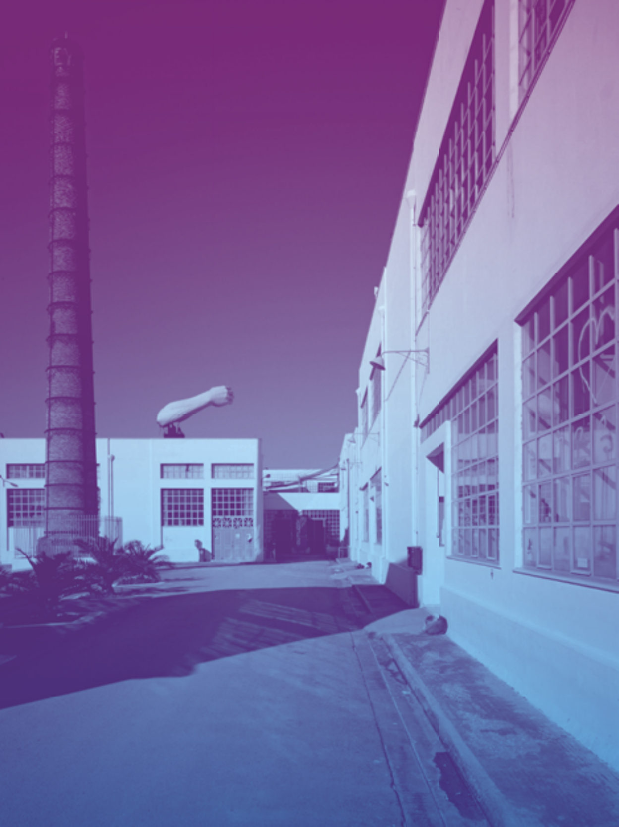
Το συγκρότημα της ΑΣΚΤ στην οδό Πειραιώς