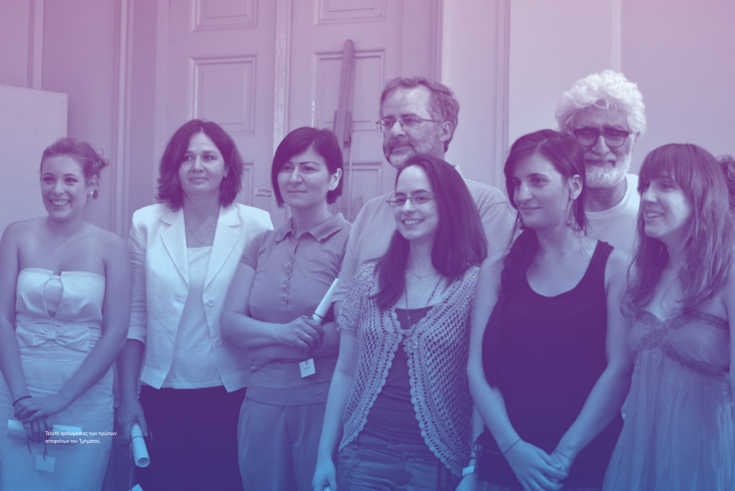
Τελετή ορκωμοσίας των πρώτων αποφοίτων του Τμήματος.