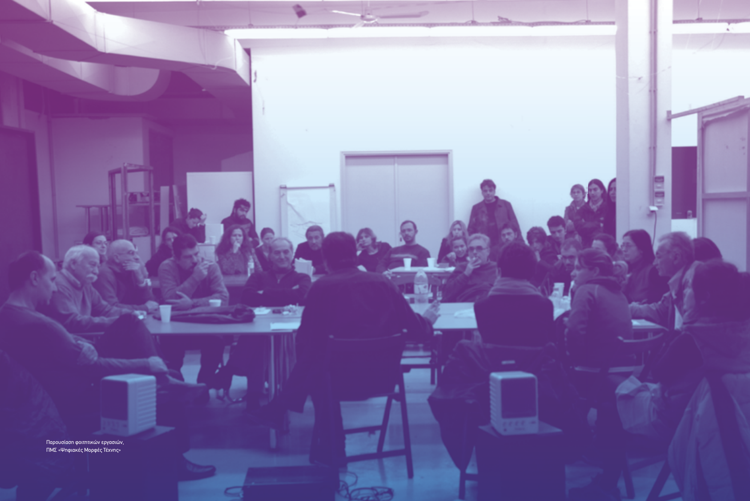
Παρουσίαση φοιτητικών εργασιών, ΠΜΣ «Ψηφιακές Μορφές Τέχνης»