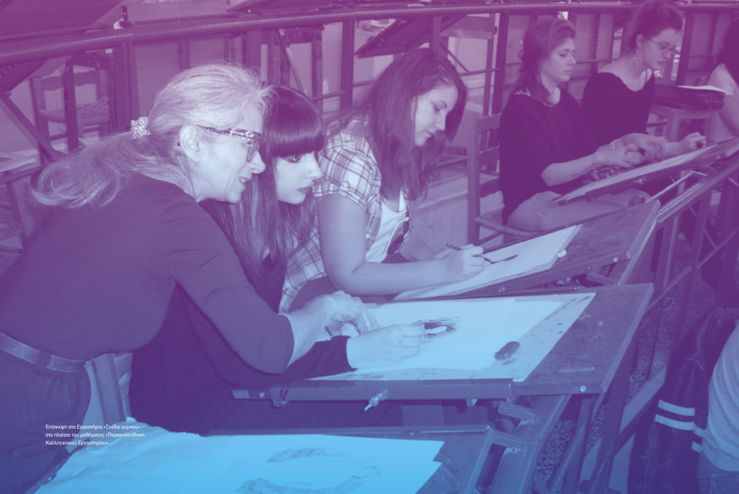
Επίσκεψη στο Εργαστήριο «Σχέδιο γυμνού» στο πλαίσιο του μαθήματος «Παρακολούθηση Καλλιτεχνικού Εργαστηρίου»